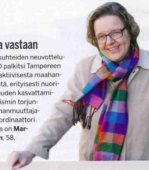
Lähteet: ETNO, Kuntaliitto, Lapin Kanssa, Lääkärilehti, Tampereen Kaupunki