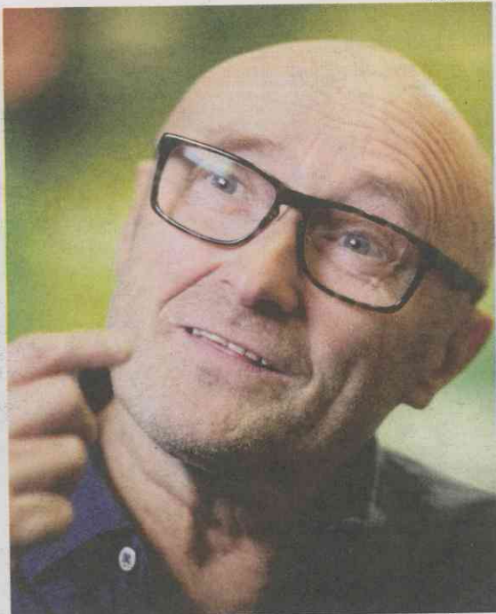
Phil Collins on yksi maailman kaikkien aikojen myydyimpiä muusikoita.