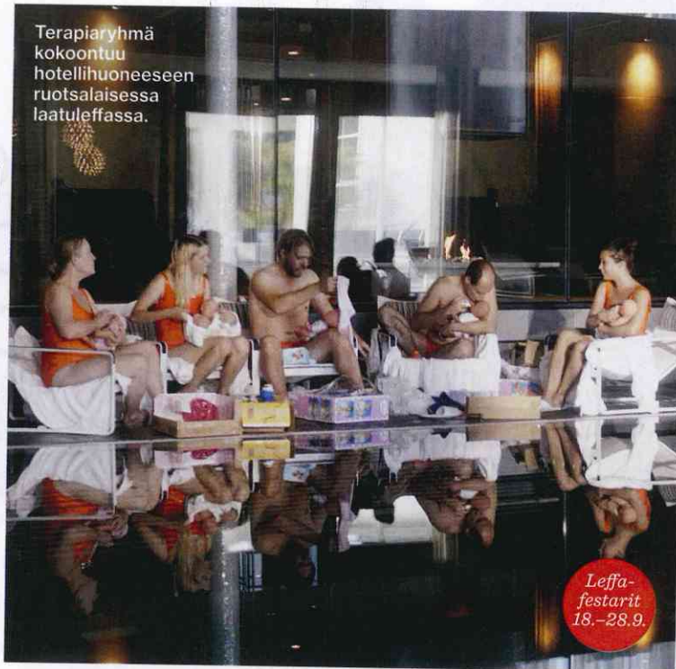
Terapiaryhmä kokoontuu hotellihuoneeseen ruotsalaisessa laatuleffassa.

Munchin lapsuus oli vaikea, sillä hänen äitinsä ja Sophie -sisarensa kuolivat tuberkuloosiin. Kovat kokemukset näkyvät etenkin