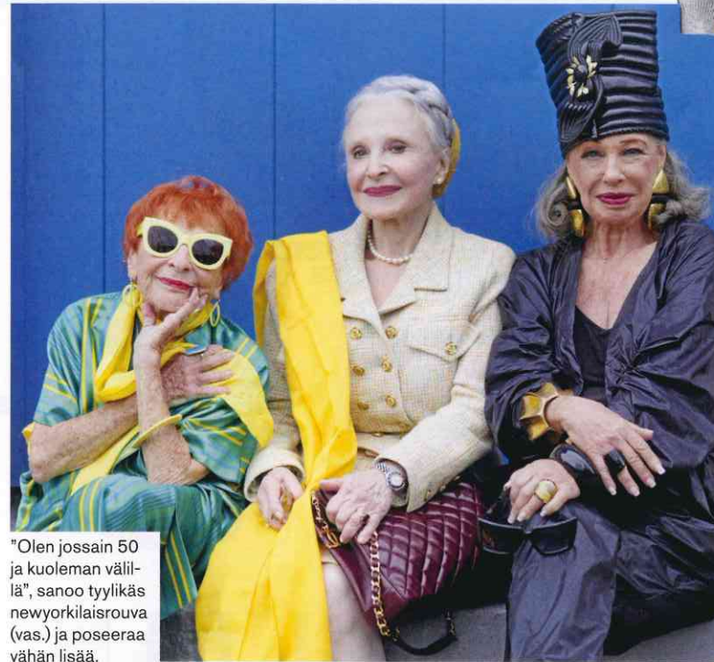
"Olen jossain 50 ja kuoleman välillä", sanoo tyylikäs newyorkilaisrouva (vas.) ja poseeraa vähän lisää.

Tämän vuoden Rakkautta & Anarkiaa -festivaaleilla nähdään kaksi kiinnostavaa muotidokumenttia. Dior and I pureutuu Raf Simonsin ensimmäisen Diorille suunnitteleman haute couture -kokoelman luomisprosessiin. Dokumentti kuvaa hienosti muotitalon uuden taiteellisen johtajan työtä ja Diorin historiaa. Advanced Style puolestaan päästää ääneen tyylikkäitä kuudenkymppiä ylittäneitä newyorkilaisnaisia. Sanoma on selvä: muoti ei tunne ikärajoja. 18.–28.9.2014, biff.fi