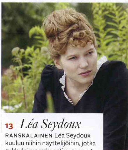
RAKKAUTTA & ANARKIAA

► Merenneito Annabel ja surullinen Marjatta -esityksen ensi-ilta Zodiakissa Kaapelitehtaalla 8.9.