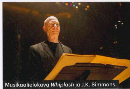
Musikaalielokuva Whiplash ja J.K. Simmons.

Tämän vuoden festivaalilla on epätavallisen paljon musiikkielokuvia. Esimerkiksi 20 Feet from Stardom kertoo taustalaulajista, huippulahjakkuuksista, jotka elävät tähtien ja menestyksen varjossa. 20 000 Days on Earth taas seuraa kuvitteellista päivää Nick Caven elämässä, osa materiaalista on dokumentaarista, osa sepitettyä. Festivaalin pääelokuvaan kuuluu Whiplash (kuva oik.), joka ”murtaa kaikki musiikkielokuvaan sisältyvät odotukset”. Musiikkielokuva harvemmin kutsutaan trillereiksi, kuten tätä.