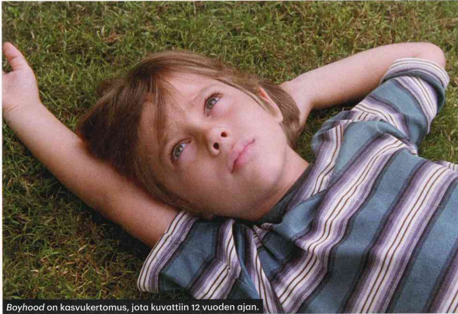
Boyhood on kasvukertomus, jota kuvattiin 12 vuoden ajan.

Elokuva | Rakkautta, anarkiaa ja musiikkia. Tämän vuoden R&A-festivaalilla erottuvat musiikkielokuvat. Toki tarjolla on myös yhteiskunnallisia ja aikaa seuraavia dokumentteja sekä erikoisia, pienistä aiheista ponnistavia indie-elokuvia. Heikki Valkama Rakkautta & Anarkiaa Helsingissä 18.–28.9., festivaaliohjelma julkaistaan 5.9. Nettisivut: hiff.fi.