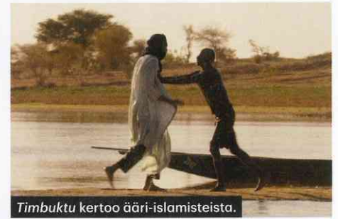
Timbuktu kertoo ääri-islamisteista.

Luvassa on pieniä suuria tarinoita. Richard Linklaterin Boyhood (kuva vas.) on kerännyt maailmalla niin mahtavat arvostelut, että se on syksyn odotetuimpia elokuvia. The Skeleton Twins on komedia keskimmästä lähestyvistä kaksosista, jotka löytävät toisensa kymmenen vuoden ja itsemurhayrityksen jälkeen. Kaksi päivää, yksi yö on draama, jossa Marion Cotillardin esittämä Sandra saa tylyn viestin palatuaan työpaikalleen sairaaloman jälkeen: työkaverit ovat valinneet hänet irtisanottavaksi.