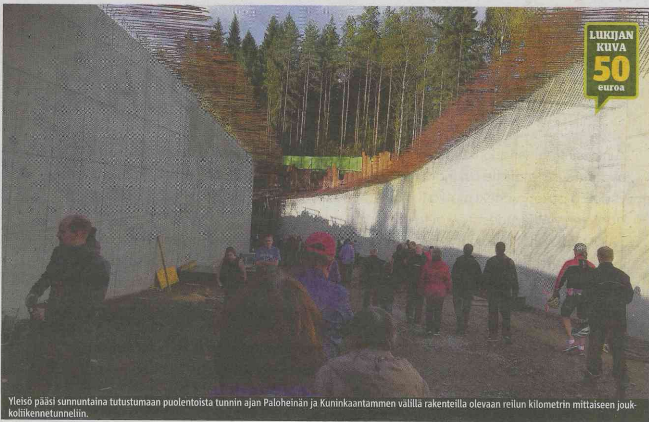
Yleisö pääsi sunnuntaina tutustumaan puoleltoista tunnin ajan Paloheinän ja Kuninkaantammen välillä rakenteilla olevaan reilun kilometrin mittaiseen joukkoliikennetunneliin.