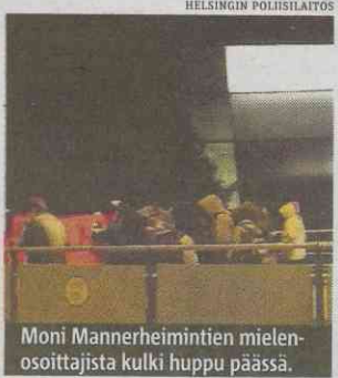
Moni Mannerheimintien mielenosoittajista kulki huppu päässä.