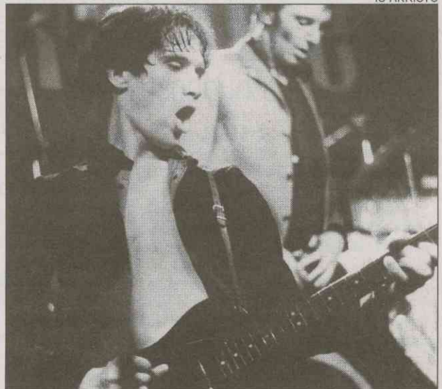
Wilko Johnson Dr. Feelgoodin keikalla vuonna 1977.