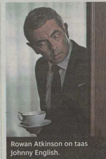
Rowan Atkinson on taas Johnny English.

● Kuuden vuoden tauon jälkeen 63-vuotiaan Rowan Atkinsonin koitti aika palata rooliinsa kompuroivana, mutta kerta toisensa jälkeen pinteestä selviävänä salaisen palvelun agenttina. Mikään ei tietenkään ole muuttunut, vaan päinvastoin Johnny Englishin autuas tipahdaminen digitaalisesta kehityksestä on koko jutun juoni. Hän käy ylpeänä taistoon huippuhakkereita vastaan vanhan koulun, analogisin keinoin, mikä tarkoittaa magneettipukua seinillä kiipeämiseen ja ritarihaarniskaa pahisten hoitelemiseen. Pakolliset puhelut pomolle (aina upea Emma Thompson) voi hoitaa lainaamalla älypuhelin viehättävältä apurilta (Olga Kurylenko) tai syöttämällä läjäpäin kolikoita (ranskalaiseen) puhelinkioskiin.