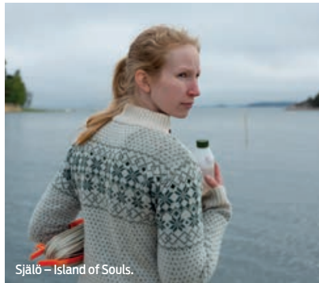
Själö – Island of Souls.