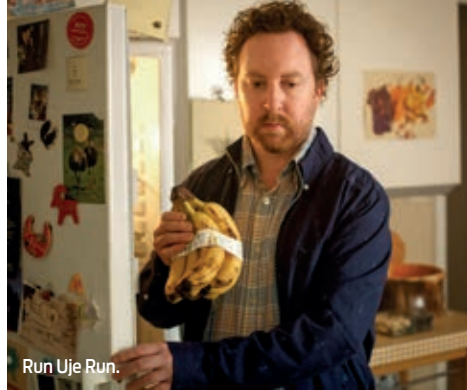
Run Uje Run.